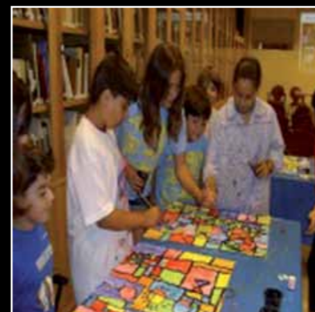
Foto nº 1 "Grupo" Los jóvenes artistas en el curso de pintura de verano.