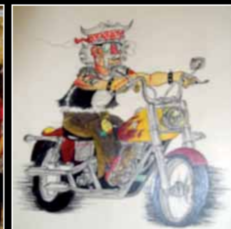
Foto nº 2 "Premio" Dibujo ganador del concurso "Dibuja tu personaje de cómic" que organizó la biblioteca para jóvenes y adultos.