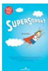
Super Sorda / Cece Bell.