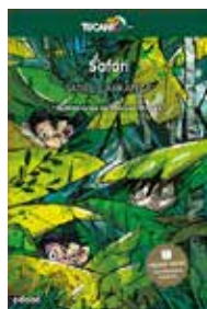
Safari / Maite Carranza. Premio Edebé de Literatura Juvenil 2019)