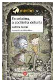
Escarlatina, a coziñeira defunta // Leticia Costas.