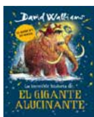
El Gigante alucinante David Walliams.